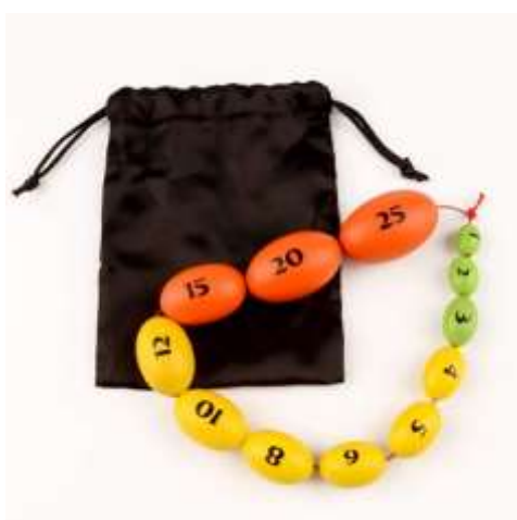
Orquidómetro de madera Prader Balls